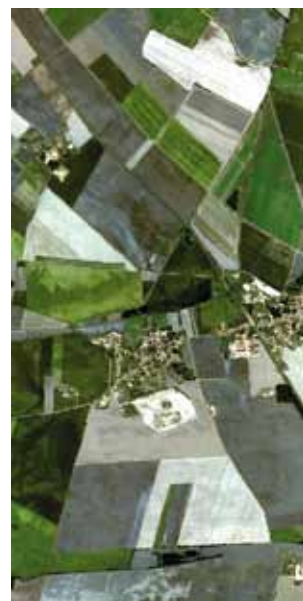
5 m píxeles